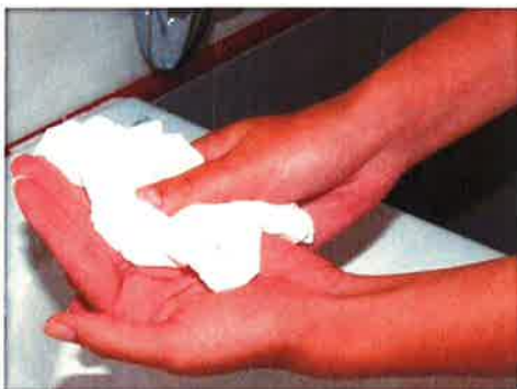
Sécate las manos con una toalla desechable