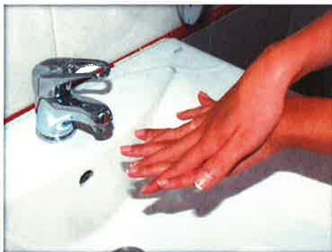
Frótate las palmas con los dedos entrelazados