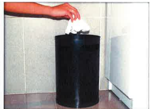
Tira la toalla a la basura