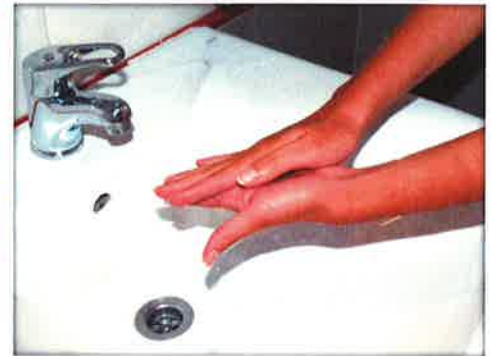
Frótate las palmas de las manos