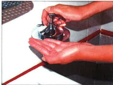
Deposita la cantidad suficiente de jabón en las palmas