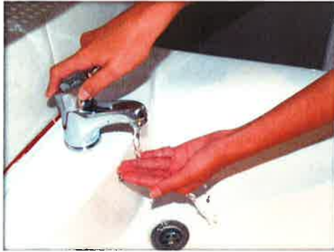
Mójate las manos

Sigue estos pasos durante el lavado de manos