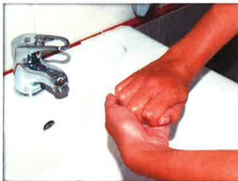
Frótate los dedos de una mano con la palma de la opuesta