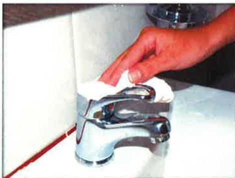
Usa la misma toalla para cerrar el grifo