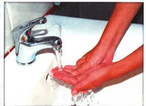
Enjuágate las manos con agua